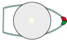
Motorbåd under 12 m